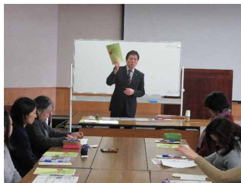
盛岡販売士協会セミナー （手書きPOP講習会）